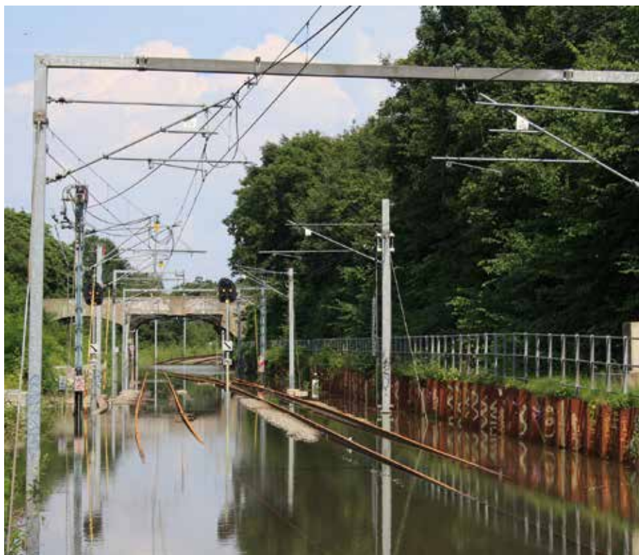
Danmark, 3. juli 2011.

- Træ og gips er meget modtageligt for skimmelsvampe, så der skal ikke meget