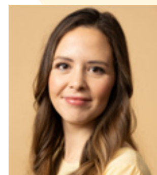
I Enhedslisten tænker man på tværs af udvalg, og ordførerne klæder hinanden på til forhandlingerne. Således vil partiet også inddrage arbejdsmiljøet i forbindelse med efterårets forhandlinger i Folketingets Forsknings- og Uddannelsesudvalg.